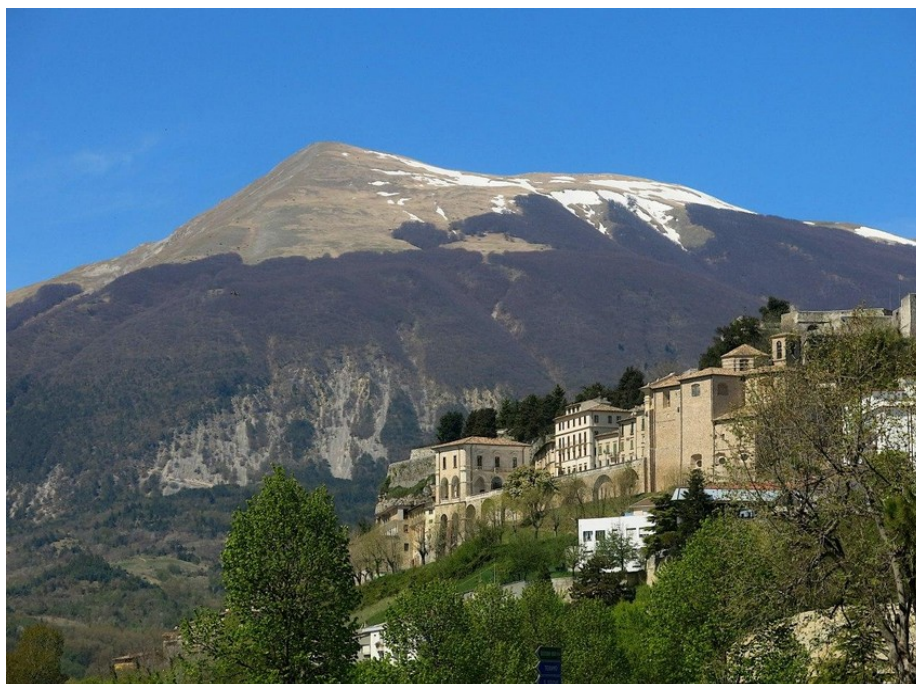
Civitella: L'abitato col Monte Girella sullo sfondo.